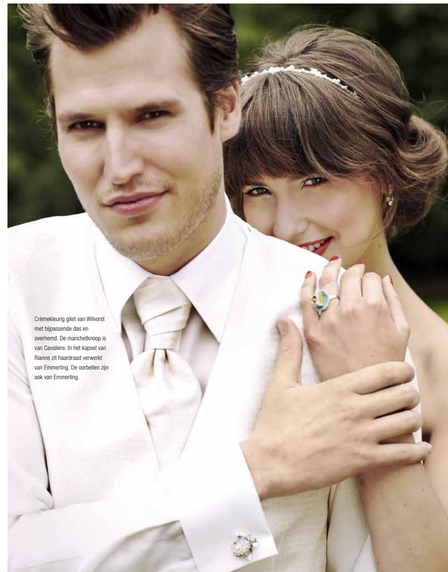
Crèmekleurig gilet van Wilvorst met bijpassende das en overhemd. De manchetknoop is van Cavaliere. In het kapsel van Rianne zit haardraad verwerkt van Emmerling. De oorbellen zijn ook van Emmerling.