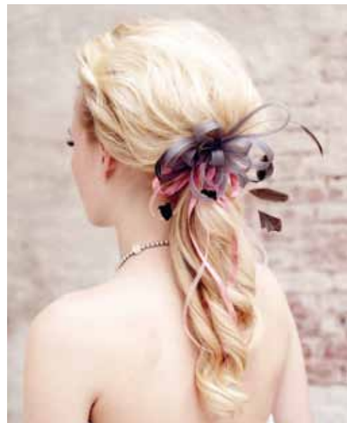
Japon van Cymbeline. Grijsje haarkam van Fashion Hair Accessories.