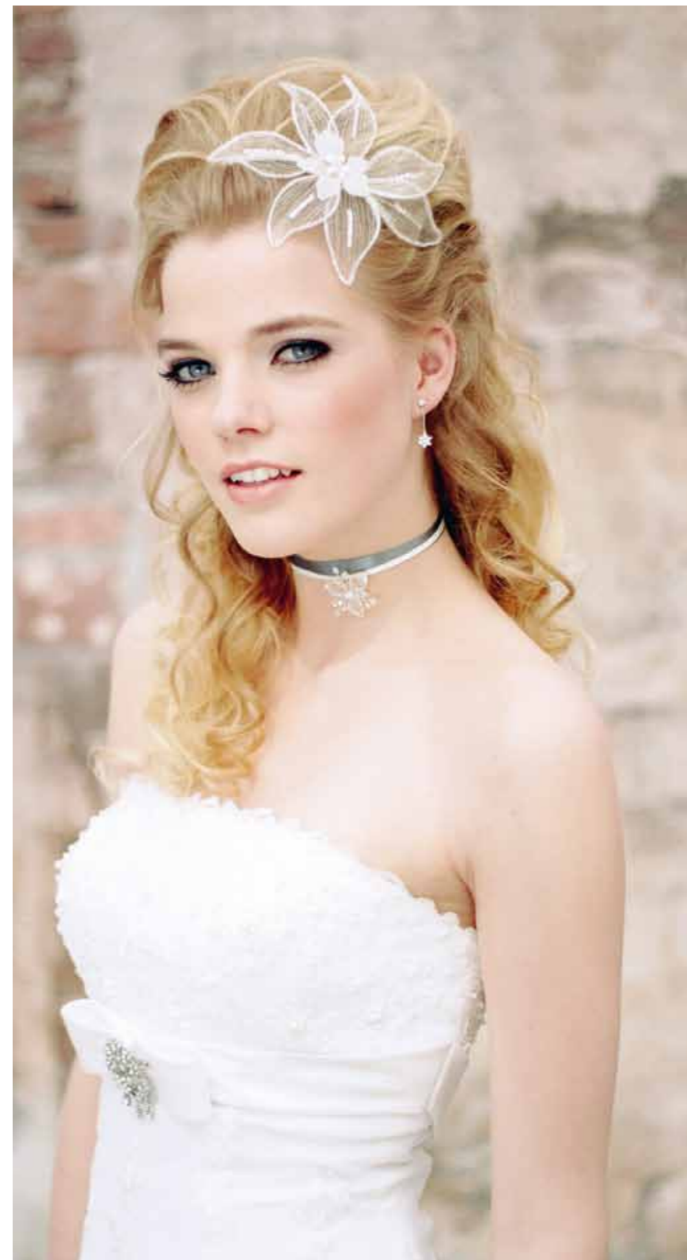
Japon van Sincerity. Tiara met bloem van Weise. Grijsje lintje met een ketting van Weise. De oorbellen zijn van Lilly.

Easy to wear en supervrouwelijk. Benadruk je persoonlijkheid in je kapsel.