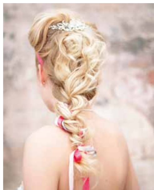
Haaraccessoire van Achberger.

Ben jij een stoer type, dan is dit kapsel vast iets voor jou. Girly en nonchalant, maar tegelijkertijd ook erg bruidsproof! Vraag je haarstylist hoe je 's avonds, met de gemaakte basis, je haar in een staart kunt dragen.