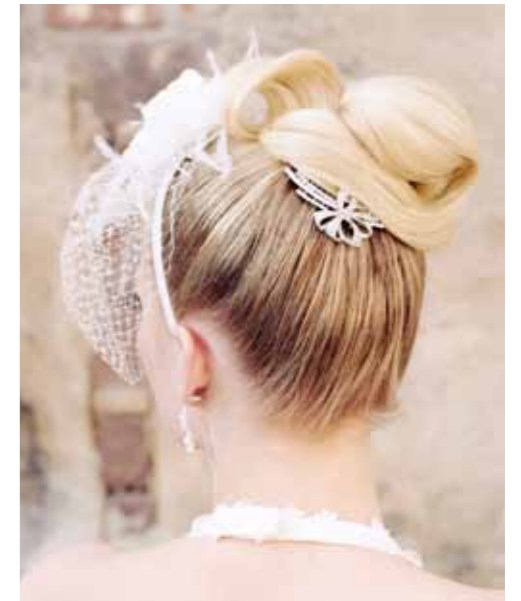
Haarkam in de vorm van een strikje van Fashion Hair Accessories.