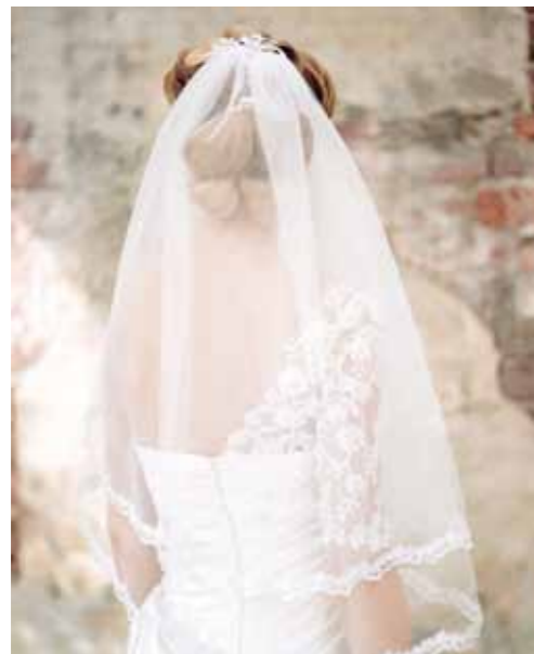
Sluier van Emmerling.

Houd je van sexy? Ga dan voor strak gestylde lokken. Het haar wordt aan de achterkant samengebracht, waardoor het kapsel ook iets schattigs krijgt. Draag overdag een sluier en 's avonds mooie, opvallende oorbellen.