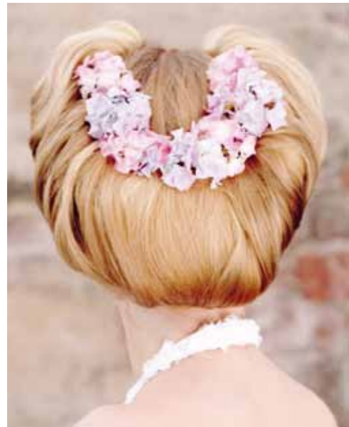
Kapsel met echte bloesem.

Ben je dol op vintage? Kijk dan eens naar de bruiloftsfoto's van je oma en je zult dit kapsel waarschijnlijk in een iets andere versie terugzien. Nostalgisch, mooi en weer helemaal van nul!