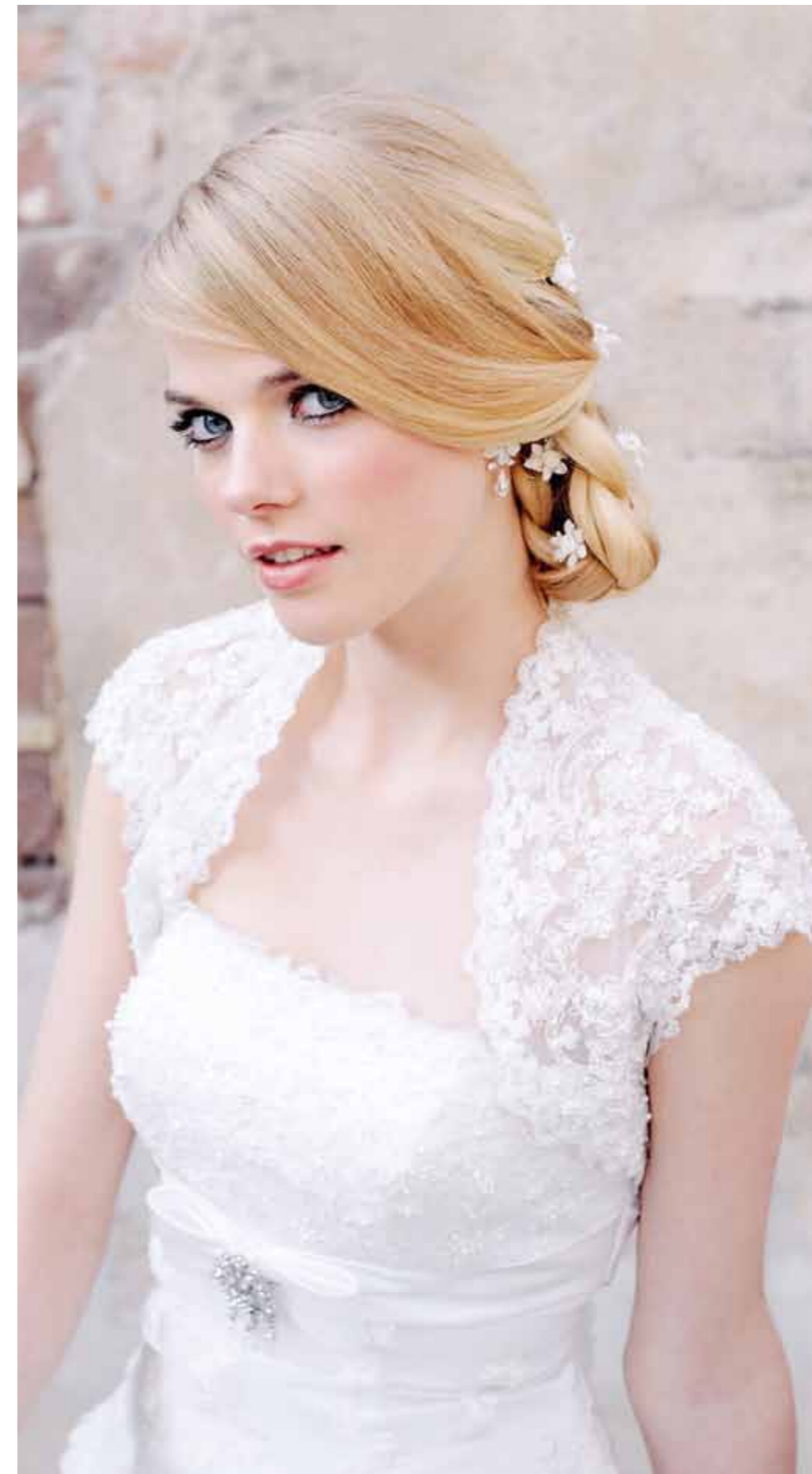
Jurk en bolero van Sincerity. De bloemetjescurls zijn van Emmerling en de oorbellen van Weise.

Ben jij het schattige type, dan ga je bijvoorbeeld voor deze schuin, opgestoken vlecht. Erg vrouwelijk en lief! Leuk met een diadeem, verse bloemen of curls of draag er een korte sluier bij.