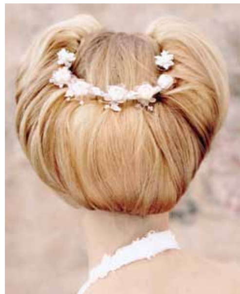
Tiara met roosjes van Emmerling.

Ben je dol op vintage? Kijk dan eens naar de bruiloftsfoto's van je oma en je zult dit kapsel waarschijnlijk in een iets andere versie terugzien. Nostalgisch, mooi en weer helemaal van nul!